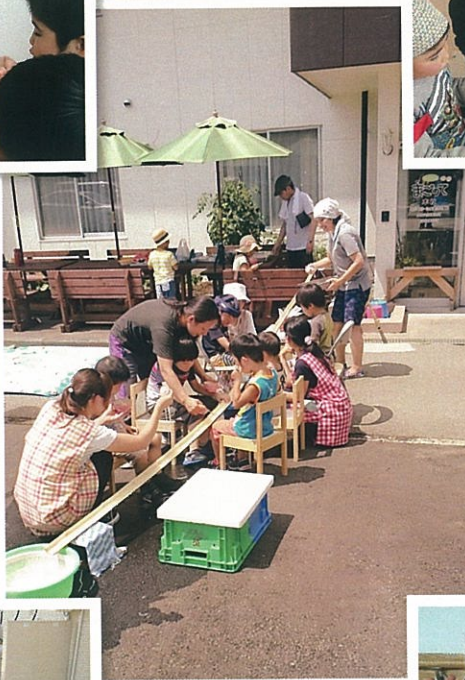
流しそうめん & スイカ割り