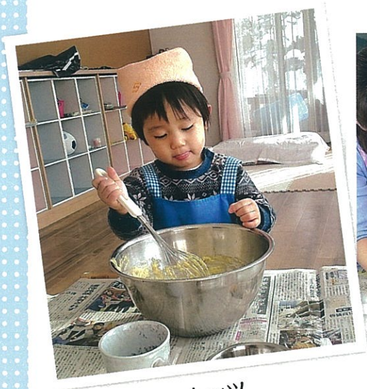
レッツ クッキング!