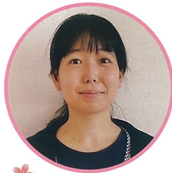
えり先生 主任 保育者