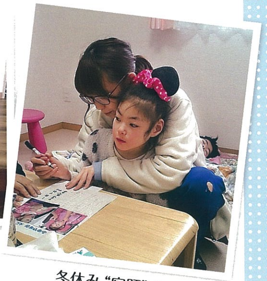
冬休み“宿題”の 取り組み