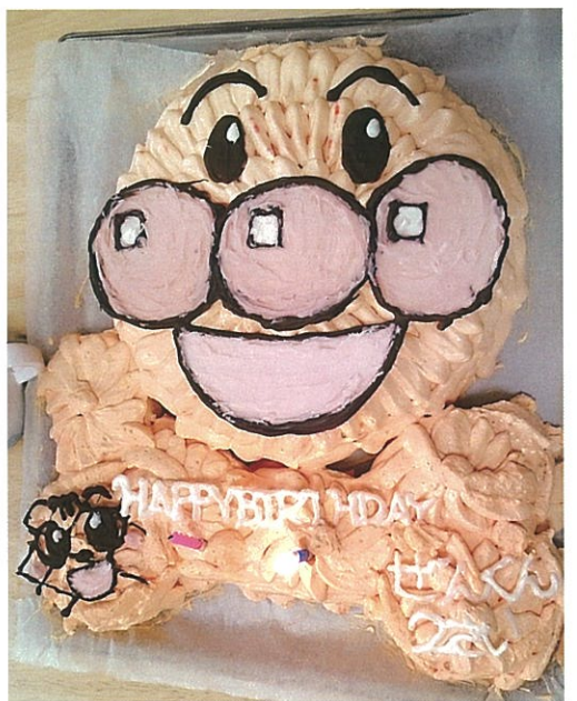
子どもたちが「おいしい!」と 言ってくれるのが毎日楽しみです。