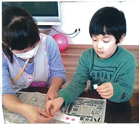
制作活動 ペタペタシール貼り